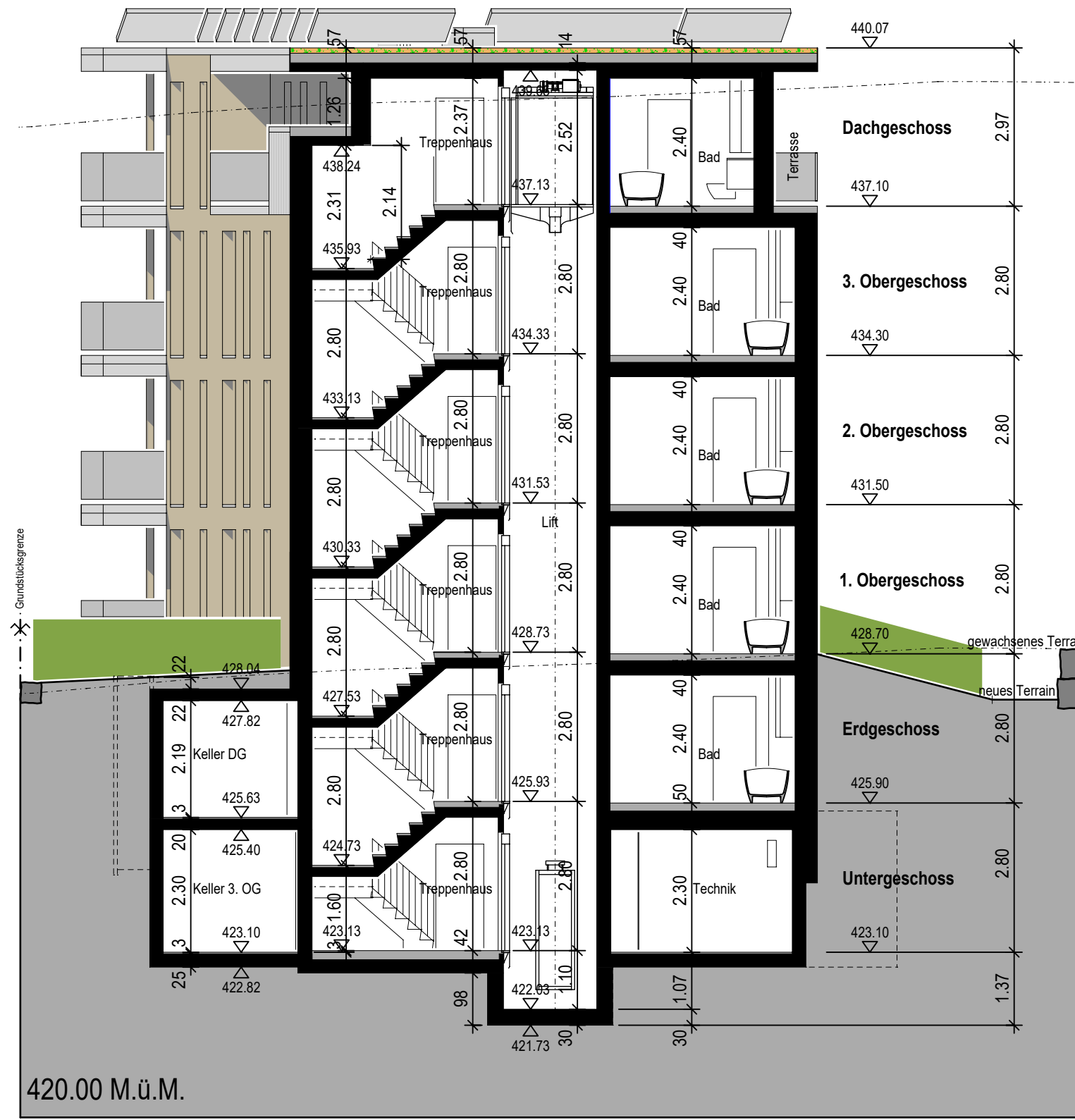
Schnitt B - B